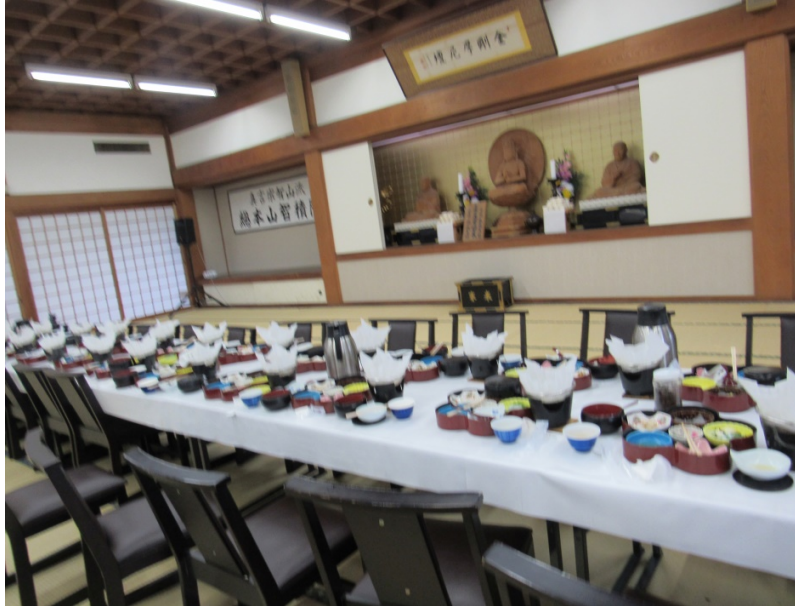
Nhà hàng Chisyakuin Ikkyuan

Đoàn dùng bữa trưa tại nhà hàng Chisyakuin Ikkyuando chùa quản lý nên có bàn thờ Phật tại trai đường và mỗi vị lãnh một mâm cơm nhỏ xinh xinh trang trí rất đẹp giống như hộp bánh mứt của Tết Nguyên đán.