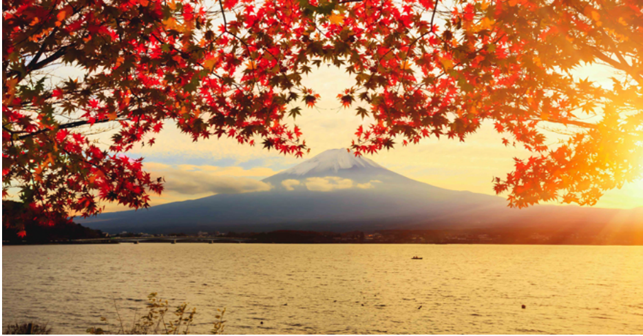
Núi Phú Sĩ giữa nắng thu lá vàng

dầu tiết ra thơm và gói xài được vài năm. Giá khoảng 10 đến 40 mỹ kim một gói tùy lớn hay nhỏ.