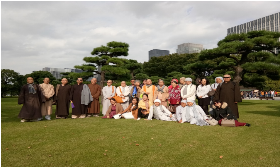
Sân cỏ trước Cung điện Hoàng gia Nhật Bản (Imperial Palace)

Chiều sau khi mua sắm đoàn tham quan Cung điện Hoàng gia Nhật Bản (imperial Palace) . Cung điện được xây dựng trên nền cũ của tòa thành cổ Edo, một vùng công viên rộng lớn được bao bọc bởi những hào nước và những bức tường thành ngay giữa trung tâm Tokyo. Vua và hoàng hậu ở dinh thự trên đồi rộng 7 hecta đất. Để giữ xanh mát cho hoàng cung, mỗi năm vua phải trả cho người làm vườn chăm sóc cây cảnh là 200 tỷ Yen Nhật Bản.