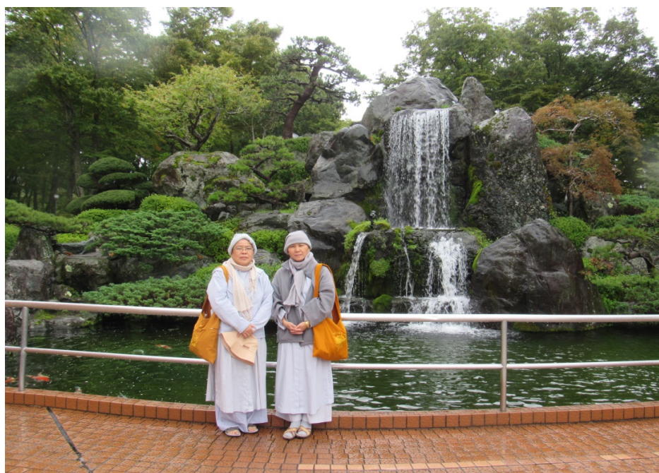
Suối đá non bộ rất đẹp phía trước khách sạn Fujinobo Kaen, Fuji San (NS Hạnh Quang-Ns Giới Hương)

Chiều 19/10 lúc 3 giờ chiều đi thăm Làng cổ Oshino Hakkai: trời cũng mưa rả rít, ai cũng mặc áo mưa và thăm viếng trong làng trong mưa. Một khung cảnh đẹp như tranh vẽ hiện ra phía cuối đường: một hồ nước màu xanh ngọc bích ẩn hiện giữa vành cỏ xanh mượt, phía xa xa là bóng cây cổ thụ xòe tán rộng soi mình xuống hồ nước tĩnh lặng. Tới thăm nhanh gọn, chụp hình, rồi đi nhận phòng nghỉ đêm tại khách sạn Fujinobo Kaen o Hakonei/Fuji area, 495-201 Subashiri, Oyamacho, Sunto-gun. Ở khách sạn có phòng tắm Onsen, nước có chất lưu huỳnh tốt cho da, có hai phòng tắm lớn cho nam riêng và nữ riêng. Có phòng phục vụ chụp hình miễn phí mặc trang phục Kimono Nhật bản từ 6 giờ chiều đến 10g tối. Gói thơm huệ hương ở đây bán rẻ hơn trên núi Phú sĩ khoảng 300 Yen cho 1 gói, nhưng không có nhiều. Lên núi xa, nên bán mắc hơn. Đoàn dùng bữa tối buffee tại khách sạn.