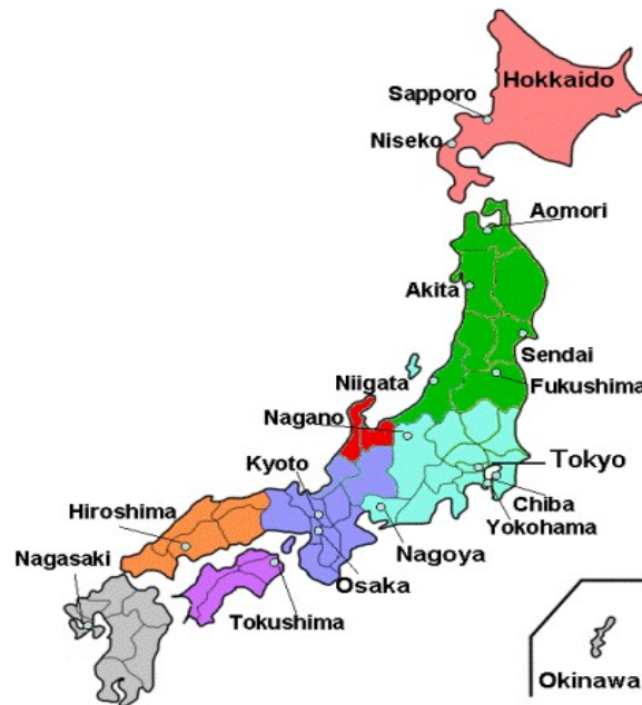
Bản đồ Nhật Bản (google)

Nhật Bản là một nước phát triển với mức sống và Chỉ số phát triển con người rất cao, trong đó người dân được hưởng tuổi thọ cao nhất thế giới, đứng hạng ba trong số những quốc gia có tỉ lệ tử vong ở trẻ sơ sinh thấp nhất thế giới, và vinh dự có số người đoạt giải Nobel nhiều nhất châu Á ( https://vi.wikipedia.org/wiki )