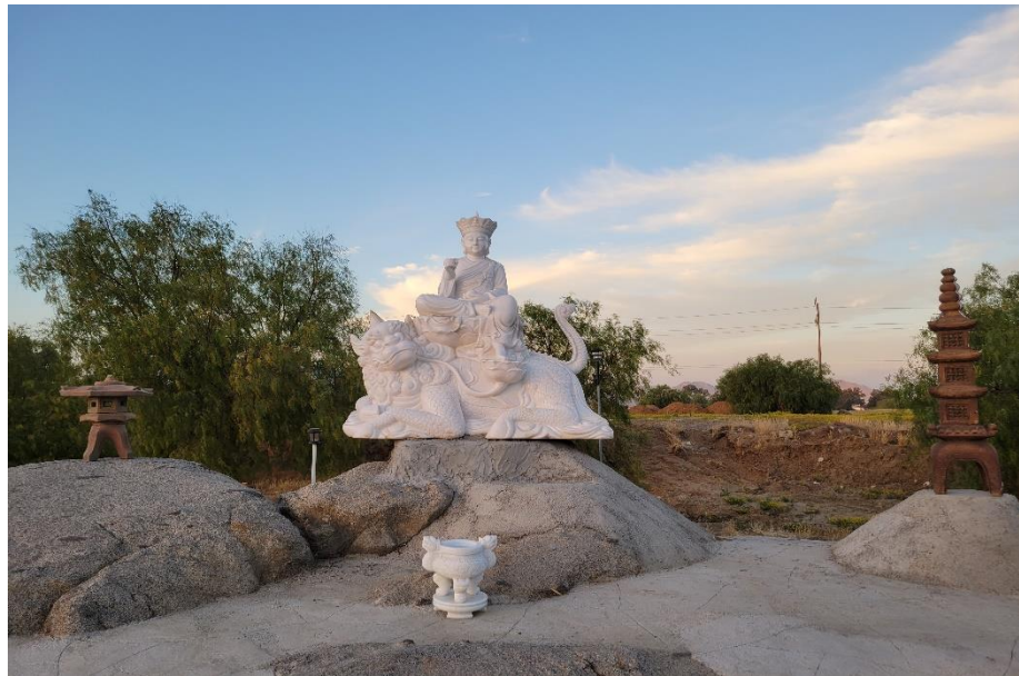
Tượng Bồ tát Địa Tạng lộ thiên bằng đá trắng Chùa Hương Sen

Ngài cưỡi trên lưng con lân là một thú quý trong tứ linh hay tứ thánh thú (long, lân, quy và phụng). Chân phải của kỳ lân thì đạp trên viên ngọc mani, dưới bụng có bộ Kinh Không Tước.