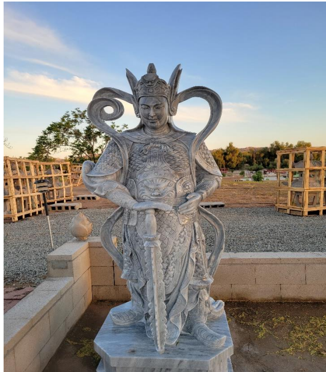
Tượng Vi Đà Hộ Pháp lộ thiên bằng đá xám trắng Chùa Hương Sen

Ngài hiện thân là một vị thần hiền, phúc hậu, một vị thiên tướng (tướng trời) oai phong, nghiêm nghị, mặc áo giáp mũ sắt và giữ chày kim cương hộ Tam bảo thường còn tại thế gian.