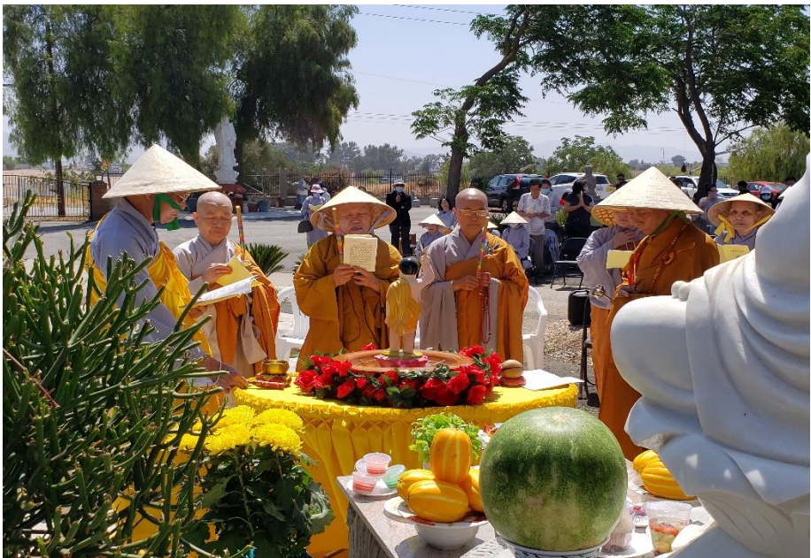
Lễ Phật đàn tại Chùa Hương Sen, ngày 30 tháng 05 năm 2021