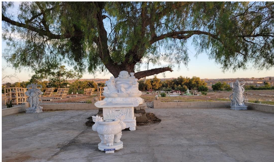
Tượng Bồ tát Di Lặc lộ thiên bằng đá trắng Chùa Hương Sen

Hình tướng của vị đương lai hạ sanh thành Phật Di Lặc mập tròn, bụng phệ tượng trưng cho sự giàu có, phồn thịnh; miệng cười toe toét dù cho sáu chú tiêu (lục tặc) chọt loét, quấy phá, thọt lỗ rúng... ngài vẫn cười hỉ xả, không phiền não, vương bần, tâm hồn rộng rang, tràn đầy lòng hoan hỉ. Vì ý nghĩa này, nên nhiều chùa Việt Nam hay Châu Á thờ ngài để mang niềm vui đến cho mình và người.