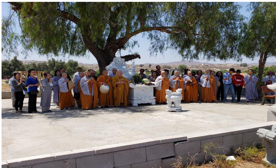
Lễ an vị Bồ tát Di Lạc tại Chùa Hương Sen