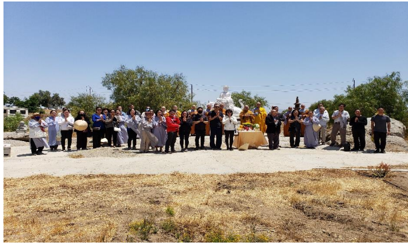
Lễ an vị Bồ tát Địa Tạng tại Chùa Hương Sen

Vùng bán sa mạc Perris, quận Riverside, hoang sơ nắng nóng đầy bụi cát hôm nay trở nên xanh mát và hòa dịu khi có các tượng Bồ tát Di Lặc, Bồ tát Địa Tạng, Hộ Pháp Vi Đà Thiên Tướng và Tiêu Diện Đại Sĩ về tọa lạc. Nhân dịp này thành tâm tri ân các thí chủ hảo tâm hỗ trợ tịnh tài và công sức trong việc thỉnh và an vị các ngài.