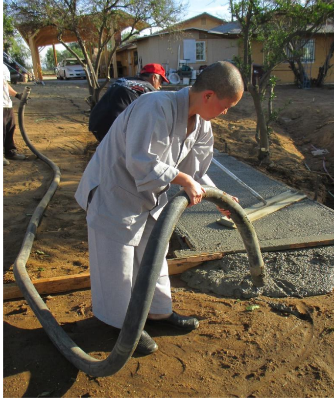
Pouring concrete, 2017