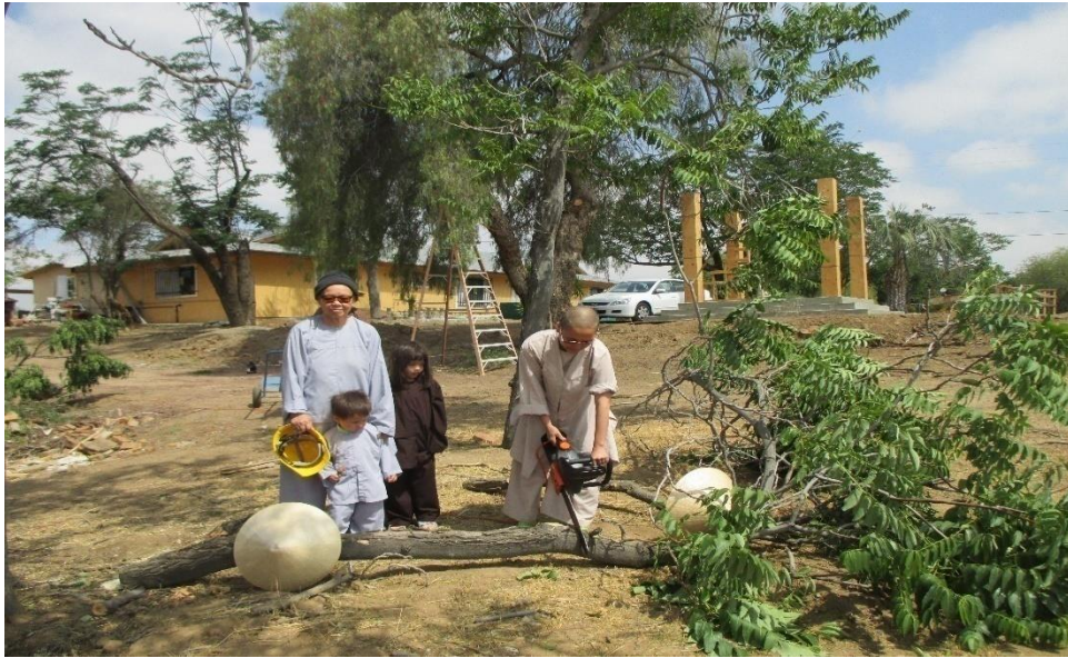
Cưa cây, năm 2014