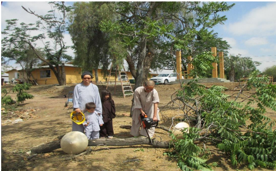
Cutting trees, 2014