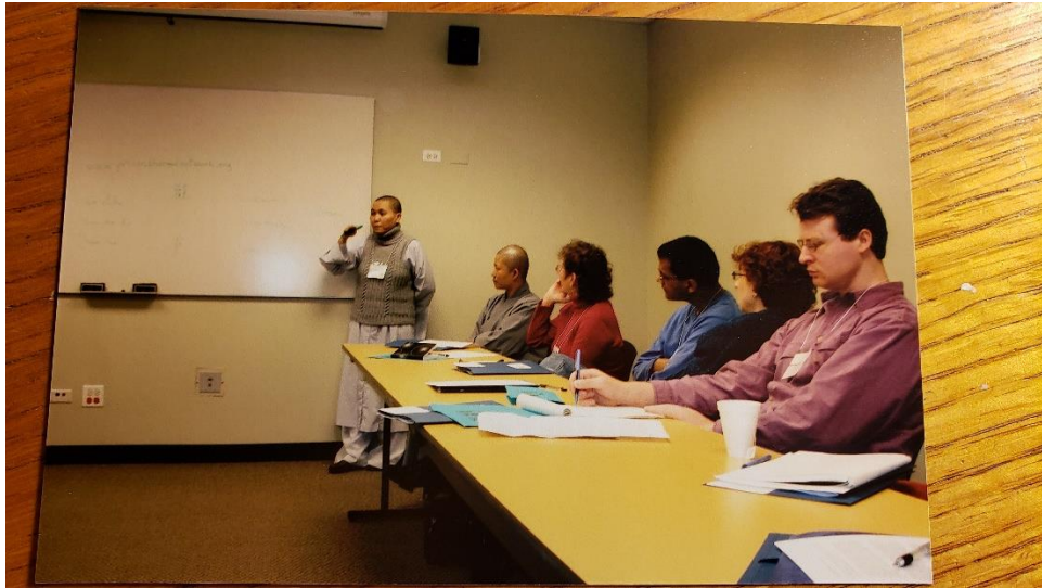
Sharing the experience with intellectuals, 2018