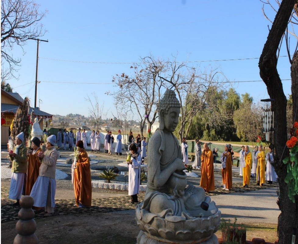
The Three Steps and a Prostration Retreat, 2019