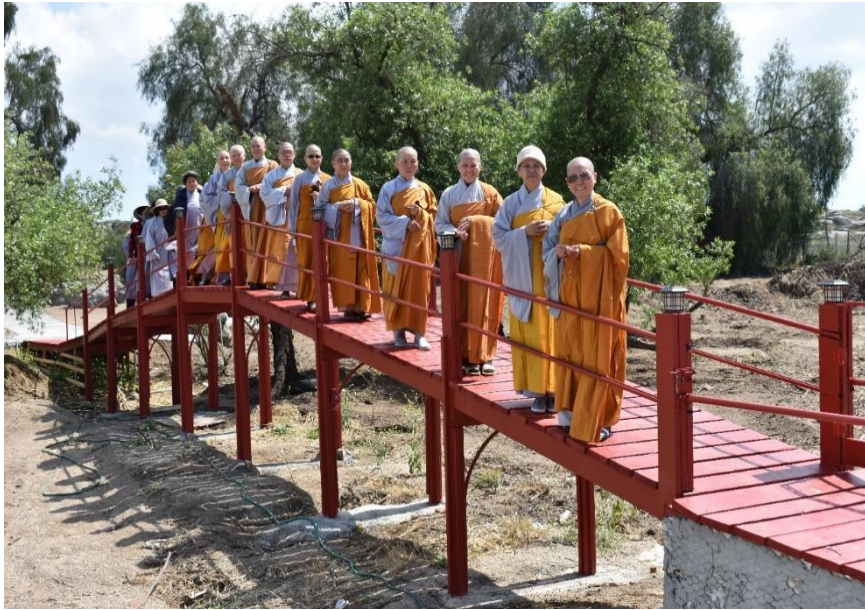
Red bridge in the back yard, 2018