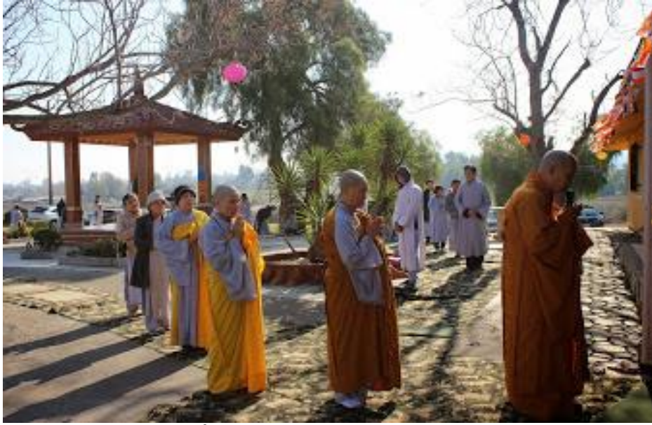
Nắng sớm mùa Đông, năm 2019