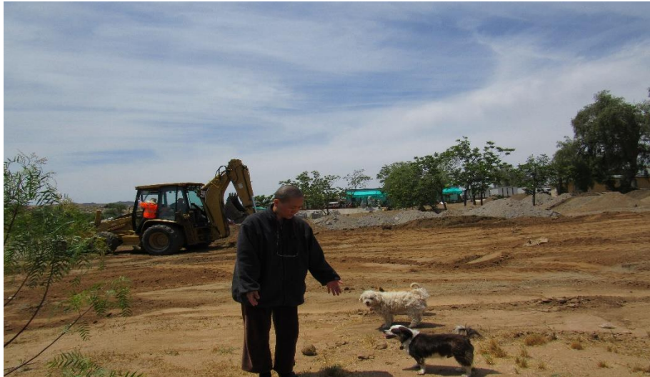
Leveling the soil to build the temple ground, 2013