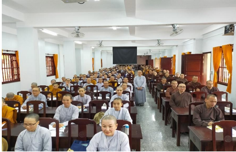
With monastic students at Vietnam Buddhist University, Sài Gòn, 2019