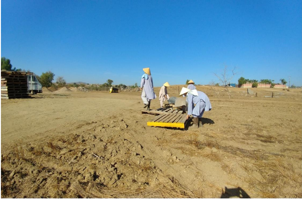
Carrying brick, 2019