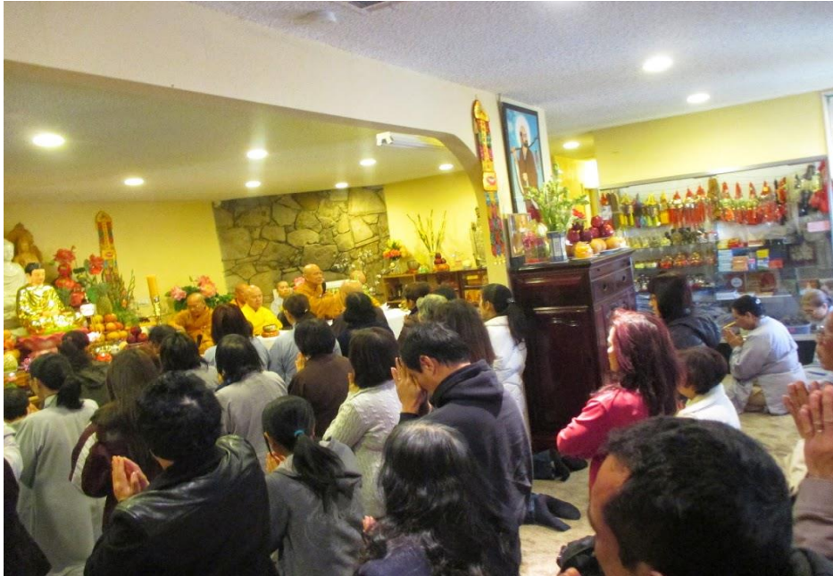
Bodhisattva Ordination for lay people, at Chùa Hương Sen Temple, 2019