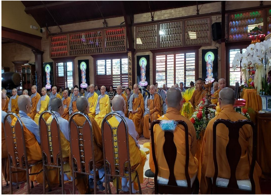
The first Ceremony of Gotami Nun Patriarch at An Lạc Temple, California, August 30, 2019