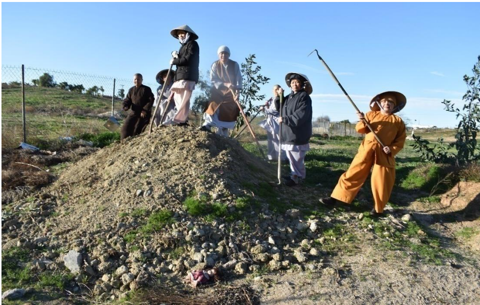
San đất làm đường, năm 2020