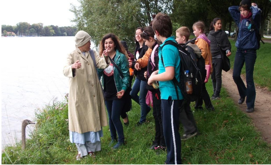
Sinh hoạt cộng đồng với học sinh Mỹ, năm 2018