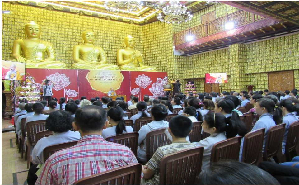
Pháp thoại Chùa Giác Ngộ, Sài Gòn, tháng 10 năm 2016