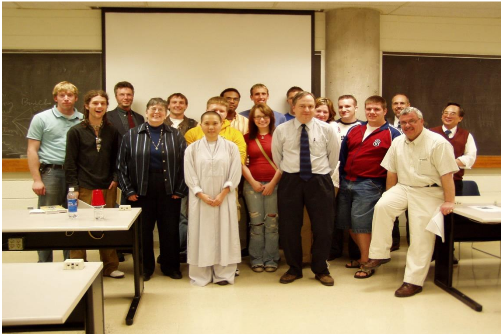
Giới thiệu đạo Phật cho sinh viên Đại Học Mỹ, năm 2017