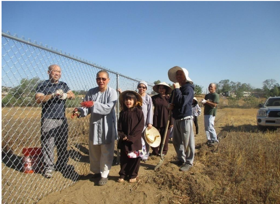
Cùng nhau chấp tác, năm 2015