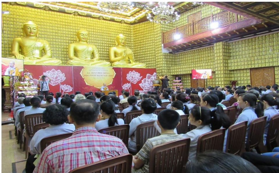
Lecture at Giác Ngộ Temple, Sài Gòn, October 2016