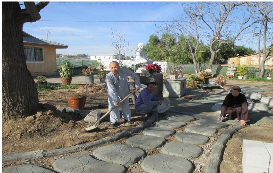
Làm đường lá sen, năm 2016