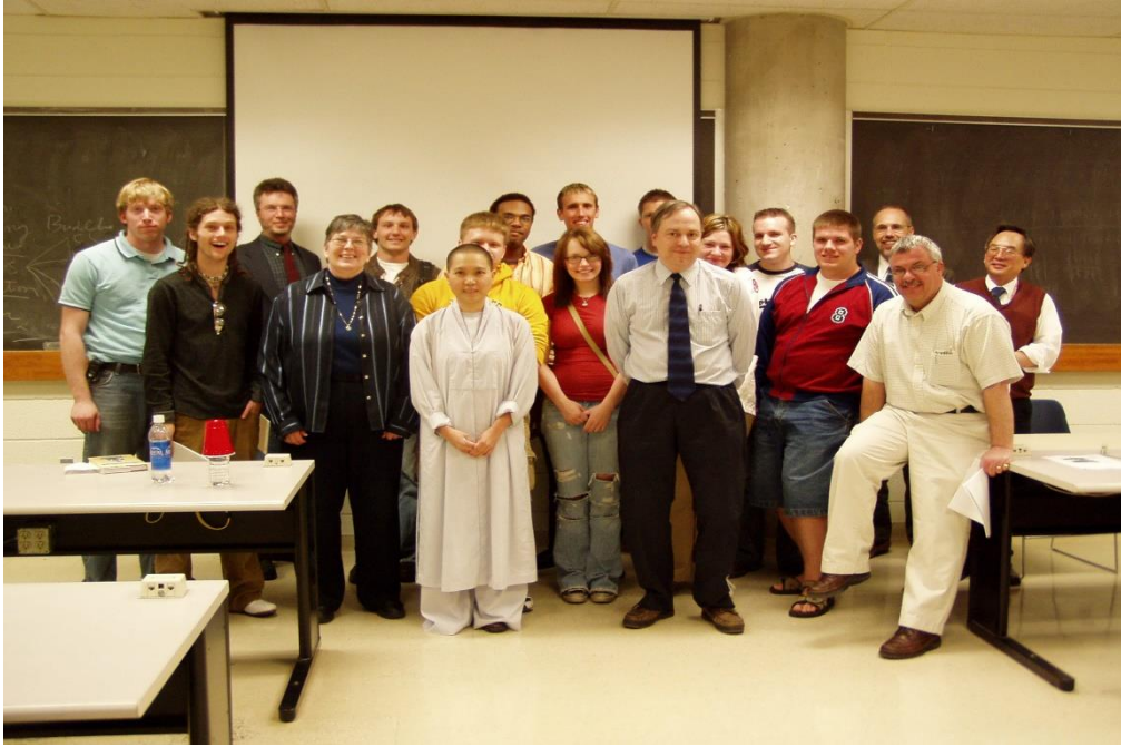
Introducing Buddhism to American Students at University, 2017