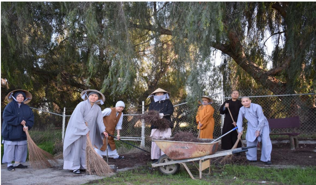
Sweeping the yard, 2020