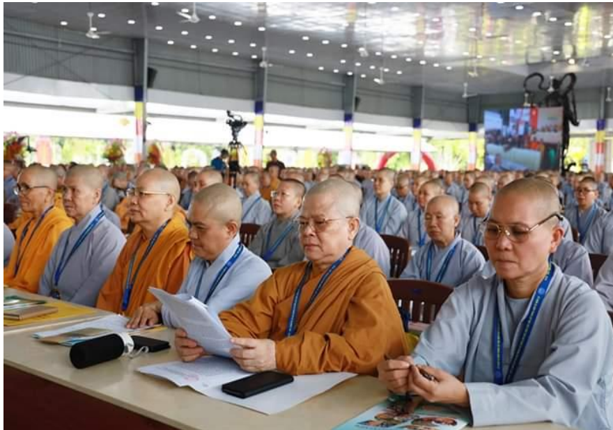
Attending the 35 th anniversary of the establishment of the Vietnam Buddhist Institute, 2019