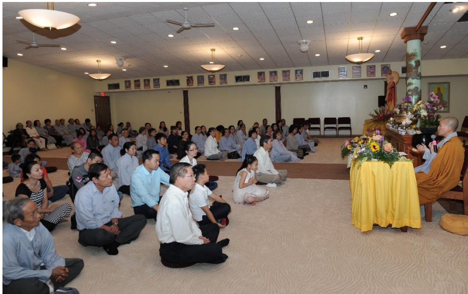
Preaching at Phước Hậu Temple, Wisconsin, 2015