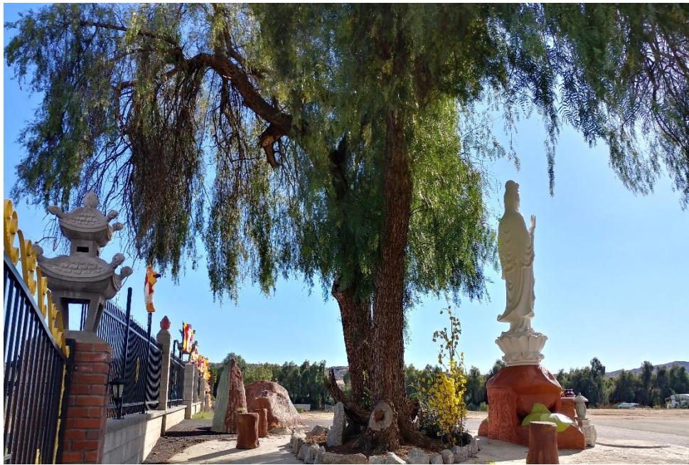
Guan Yin front yard, 2018