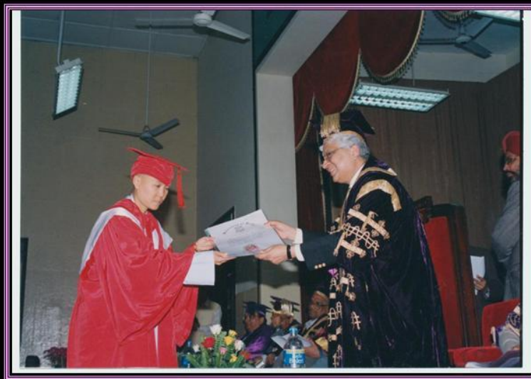
Tốt nghiệp Tiến Sĩ Phật Học tại Trường Đại học Delhi, năm 2013