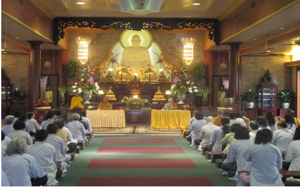
Giving a sermon at Việt Nam Temple, Texas, 2013