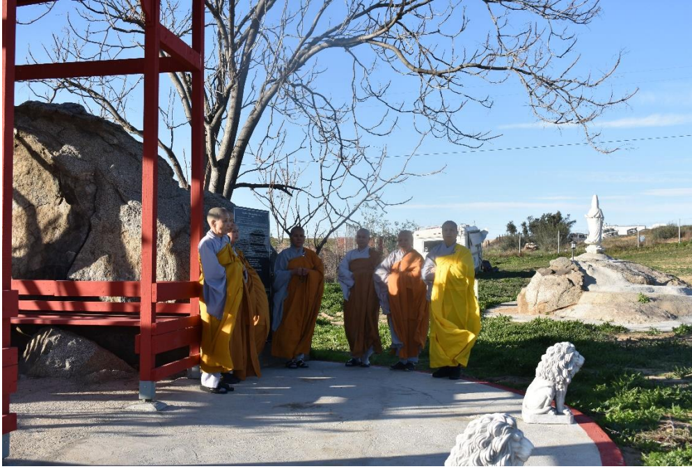
Inscriptive stupa, 2018