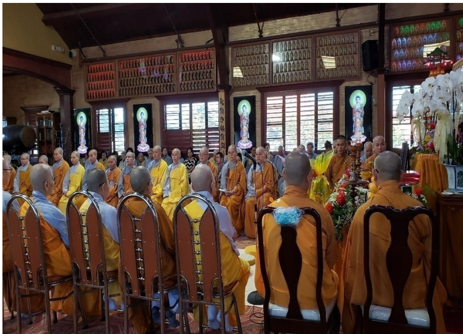
Chư Ni tổ chức Ngày giỗ Thánh Tổ Kiều Đàm Di lần đầu tiên tại Chùa An Lạc, California, ngày 30/08/2019