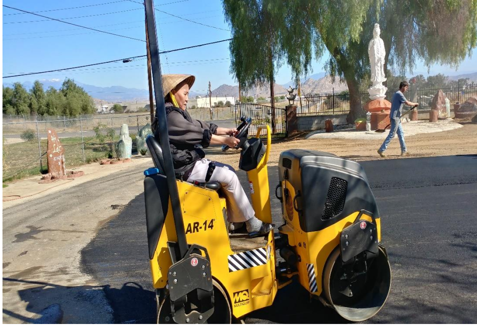
Tráng nhựa làm bãi đậu xe, năm 2016