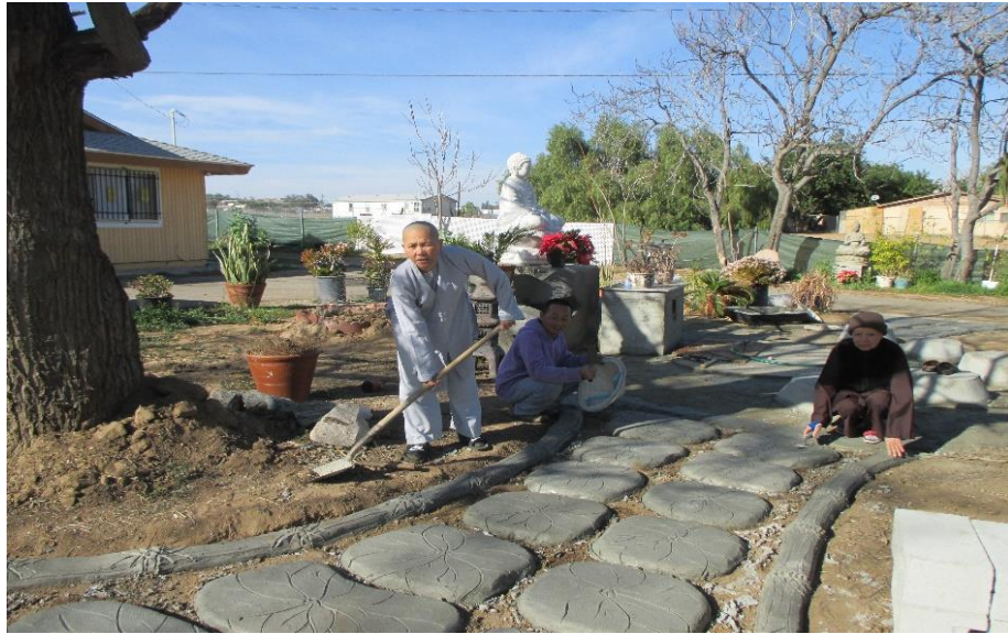
Making the lotus road, 2016