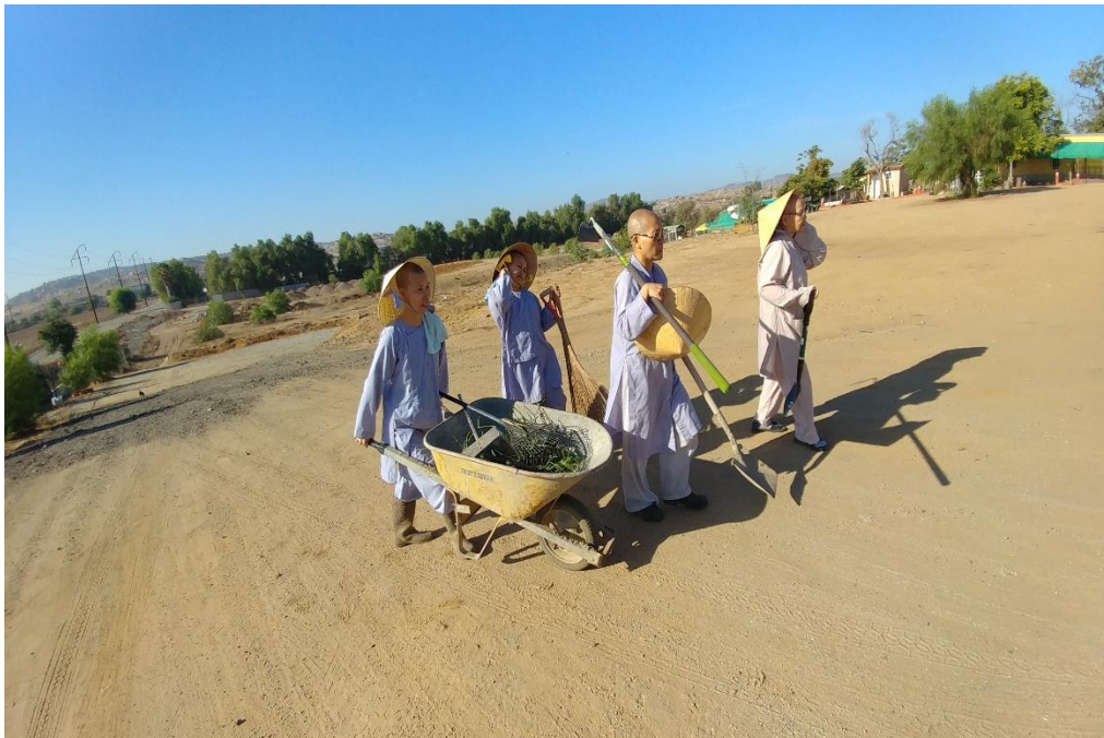
Digging soil, 2019