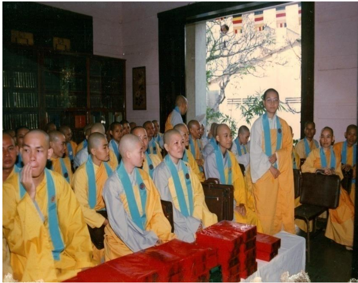
Tốt nghiệp Cử nhân Phật học tại trường Cao Cấp Phật Học năm 1993