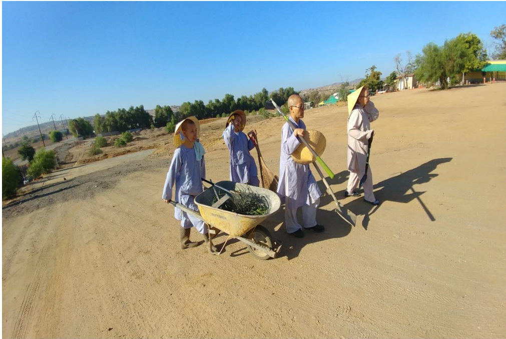
Cuốc đất, năm 2019