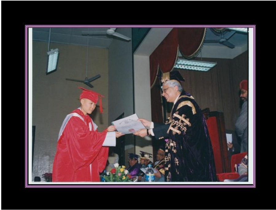
PhD, Doctor of Philosophy Degree at Delhi University, India, 2013