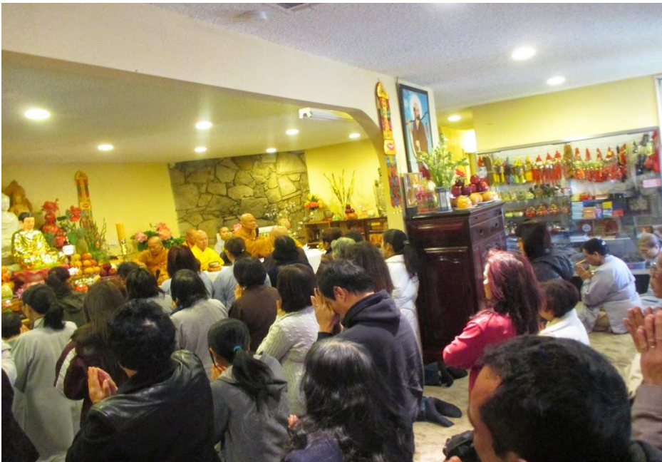
Truyền giới Bồ Tát tại gia tại Chùa Hương Sen, năm 2019