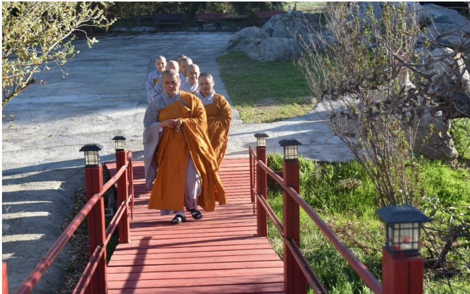
Vững chãi từng bước chân, năm 2020