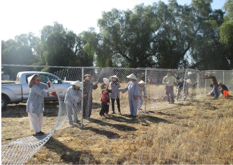
Cột hàng rào kẽm, năm 2015