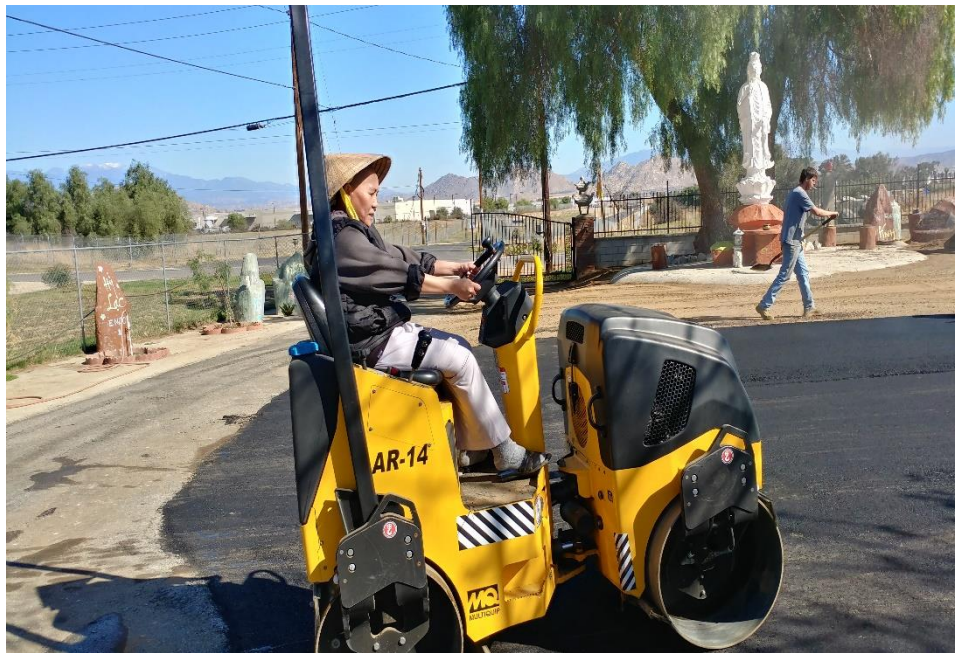
Making the parking lot, 2016