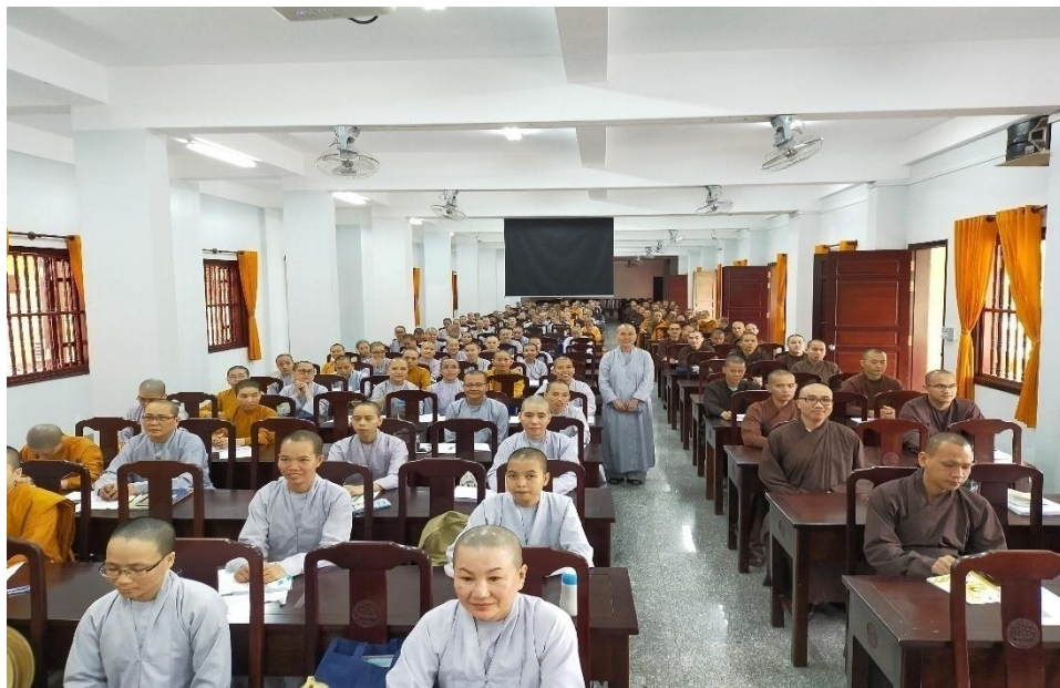
Với Tăng Ni sinh Học Viện PGVN, Sài Gòn, năm 2019