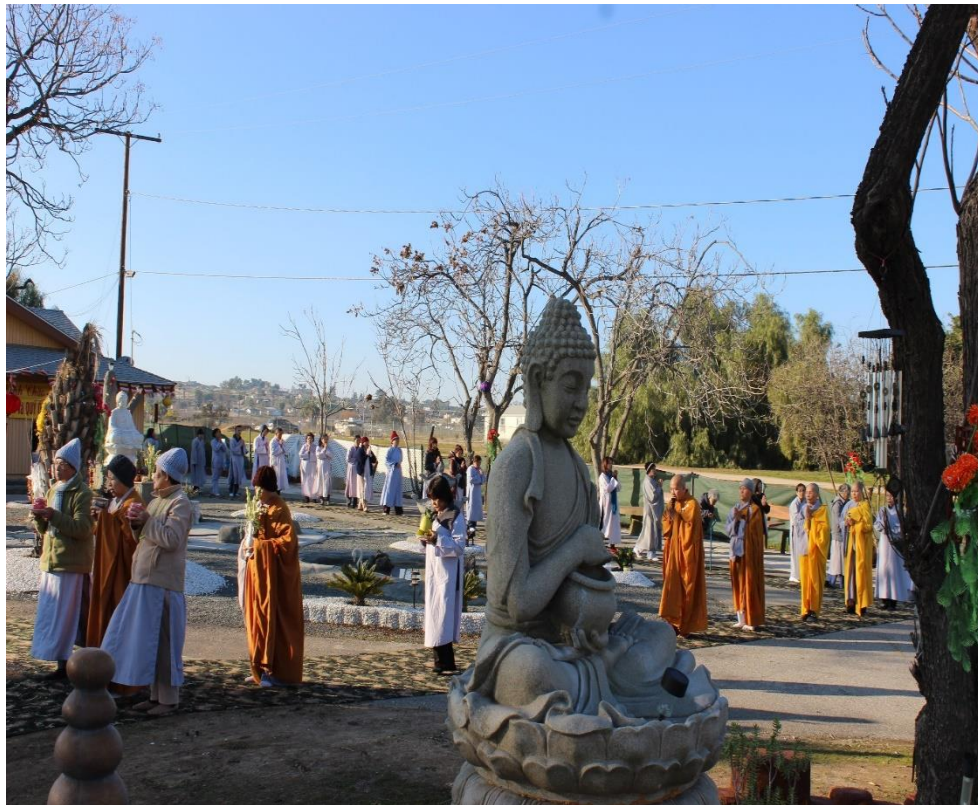
Lạy Tam Bộ Nhất Bái, năm 2019