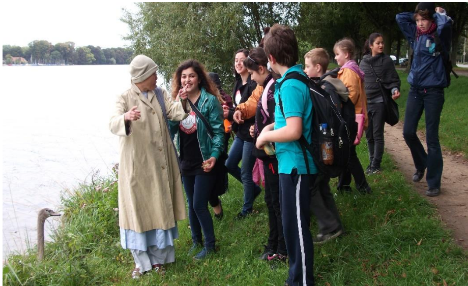
Communicating with American pupils, 2018