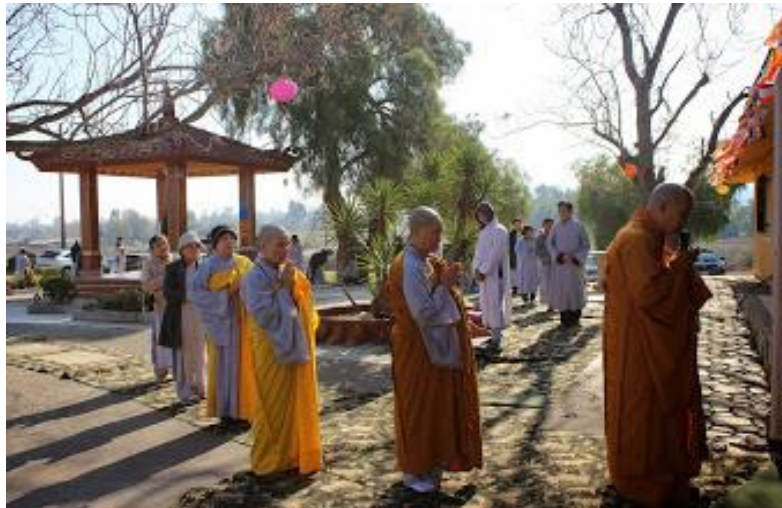
Sunshine in winter, 2019