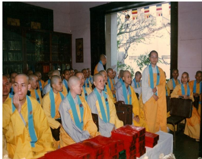
Graduated from the Bachelor of Buddhist Studies program at the Advanced Buddhist Institute, Sài Gòn, 1993