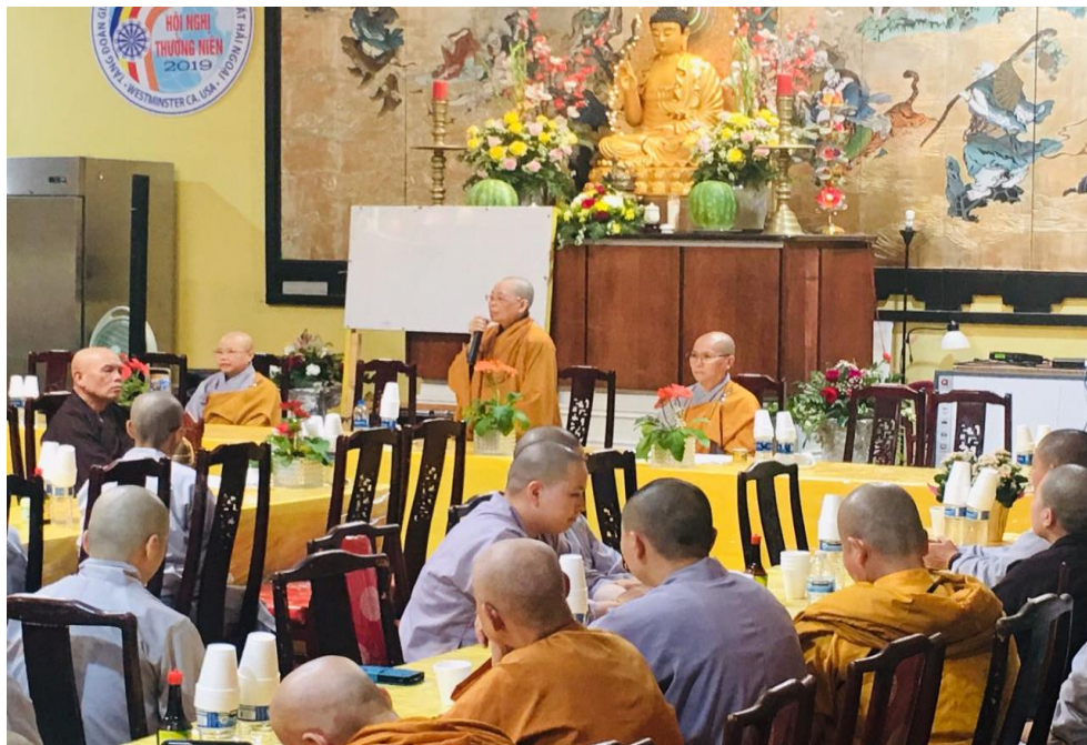
A talk at the Summer Retreat at Điều Ngự Temple, June 2019