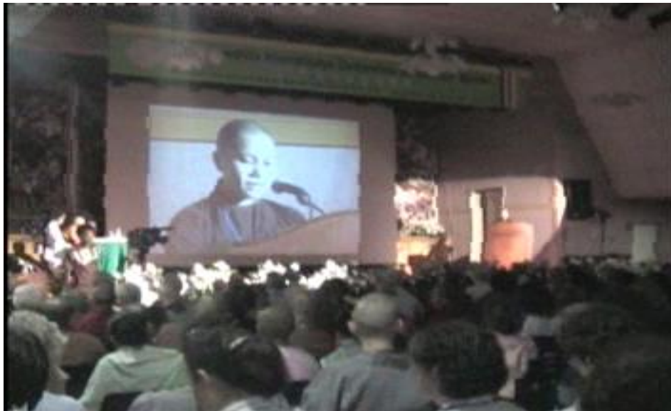
Thuyết giảng cho cộng đồng, năm 2016