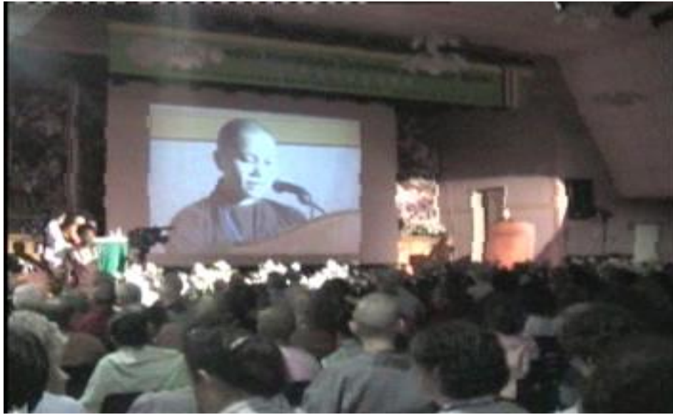
Talk at community, 2016