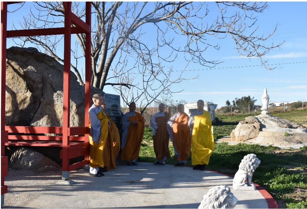
Tháp bia ký, năm 2018