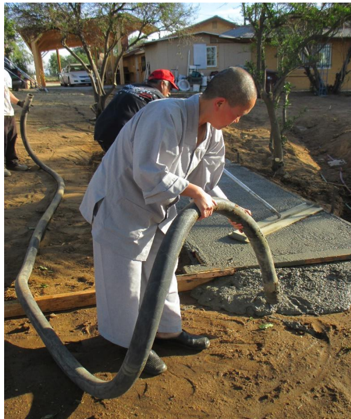
Đổ bê tông, năm 2017