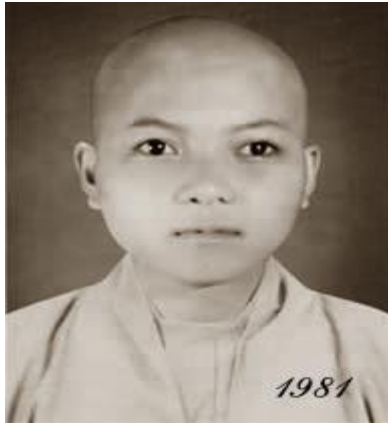
Thức Xoa Ma Na Giới Hương năm 1982