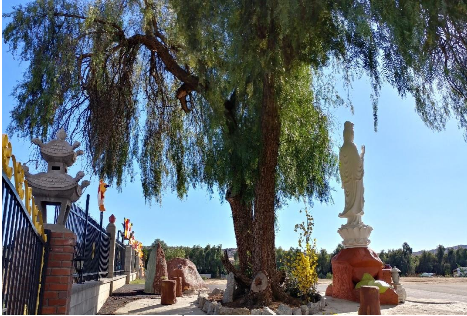
Quan Âm sân trước, năm 2018