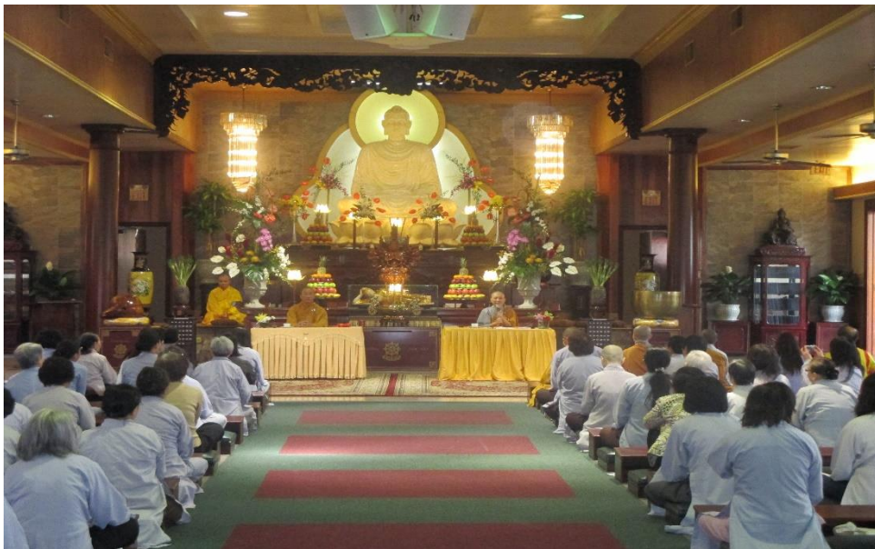
Thuyết giảng Chùa Việt Nam, Texas, năm 2013