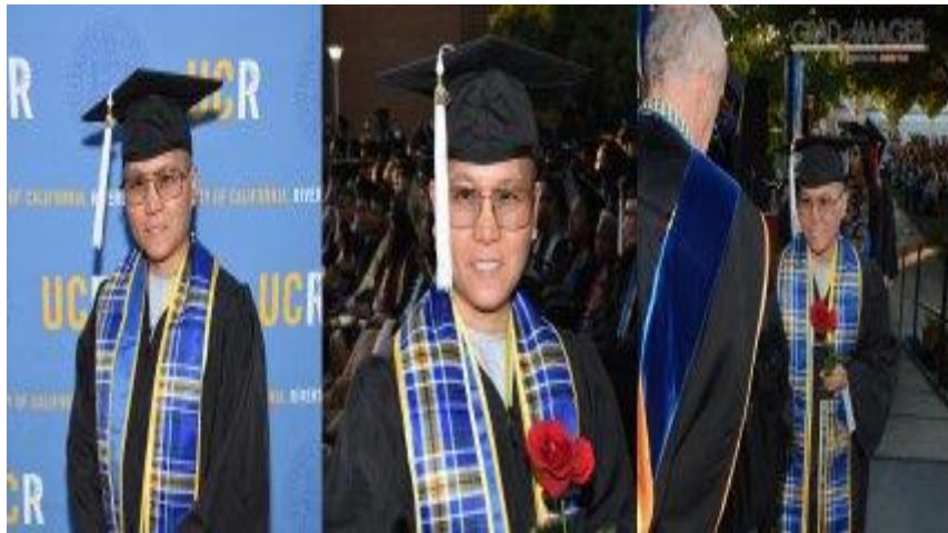
Graduated with a Degree in Literature from the University of California, Riverside in 2016