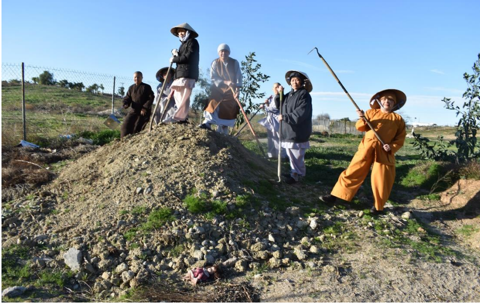
Balancing the soil, 2020