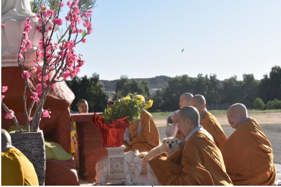
Cùng nhau tọa thiền, năm 2020