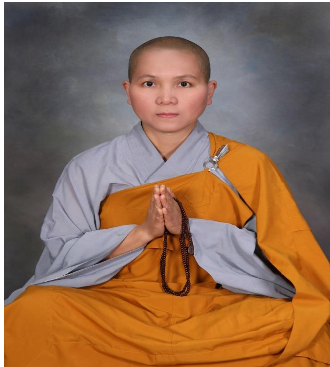
Tỳ Kheo Ni Giới Hương 2019