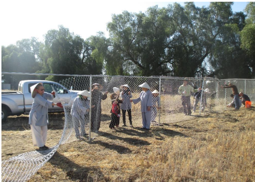
Connecting the fence, 2015