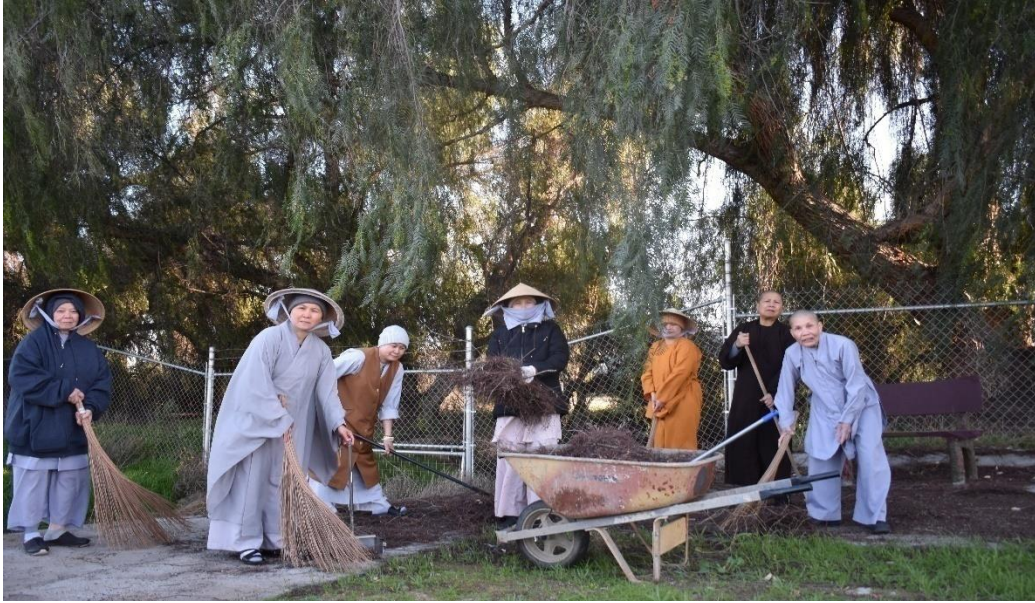
Quét sân, năm 2020