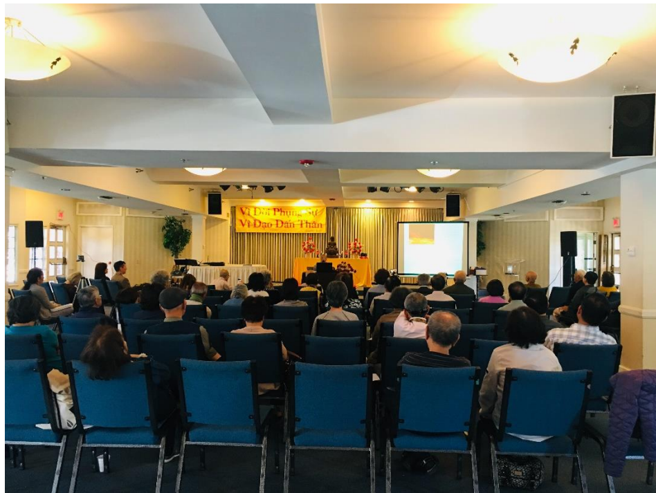
Giving a lecture at the Sangha Center of Đuốc Tuệ Buddhist Association, 2020