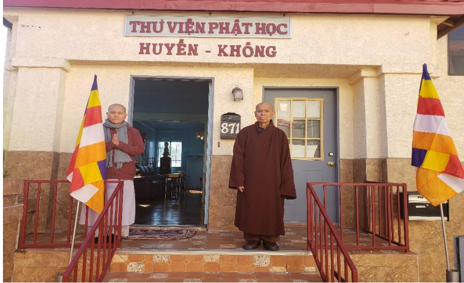
Khai mạc thư viện Huyền Không (ngày 10/03/2021)