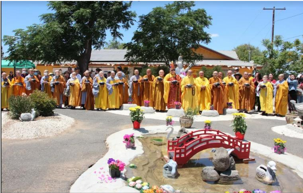
Cổ Phật Khất thực chùa Hương Sen (ngày 29/05/2022)