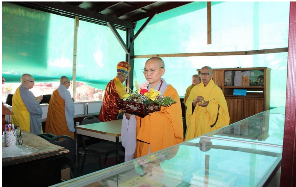
Sái tịnh Thư Viện Hương Sen (ngày 29/05/2022)