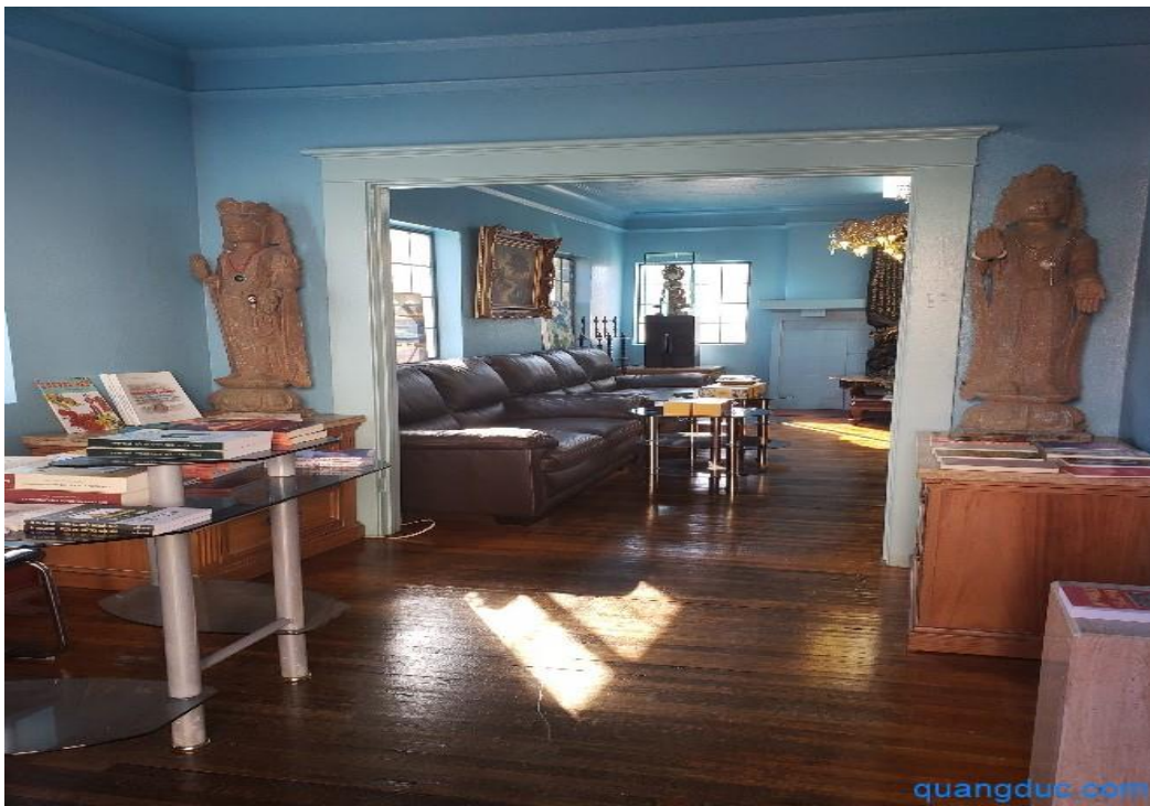
Tủ sách trưng bày