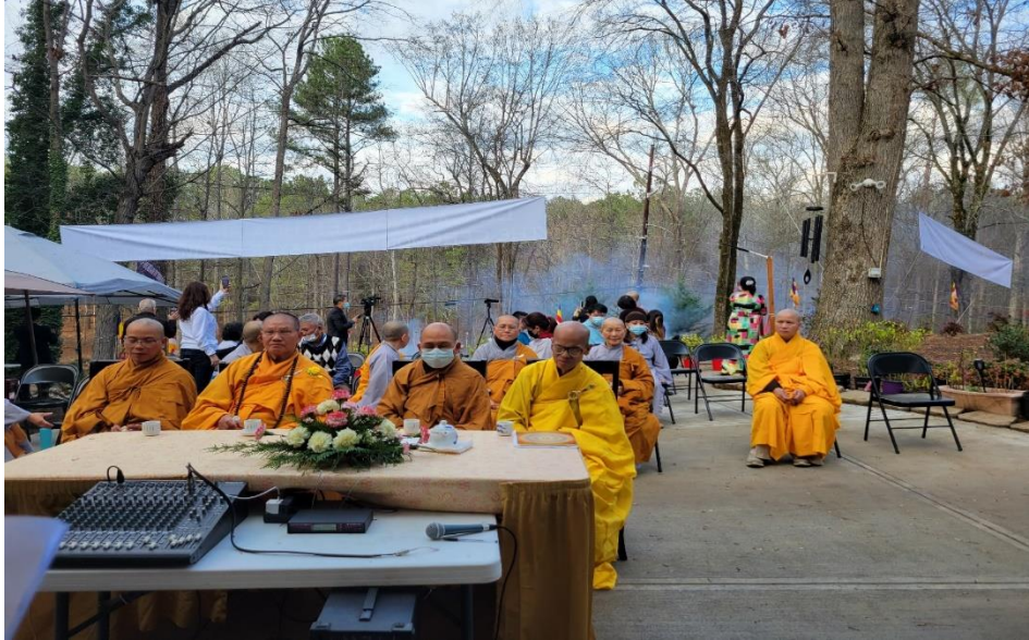
Photo: Đốt pháo đón xuân 2022