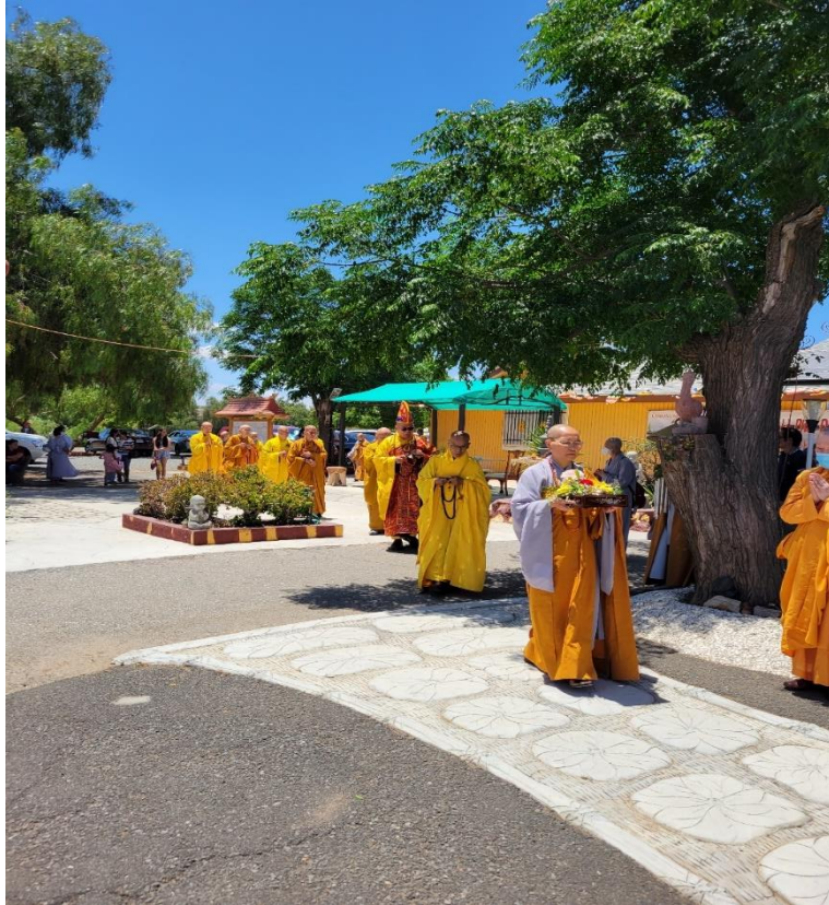
Thỉnh sư tại chùa Hương Sen (ngày 29/05/2022)