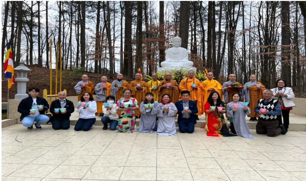
Photo: Lễ dâng nén tưởng niệm