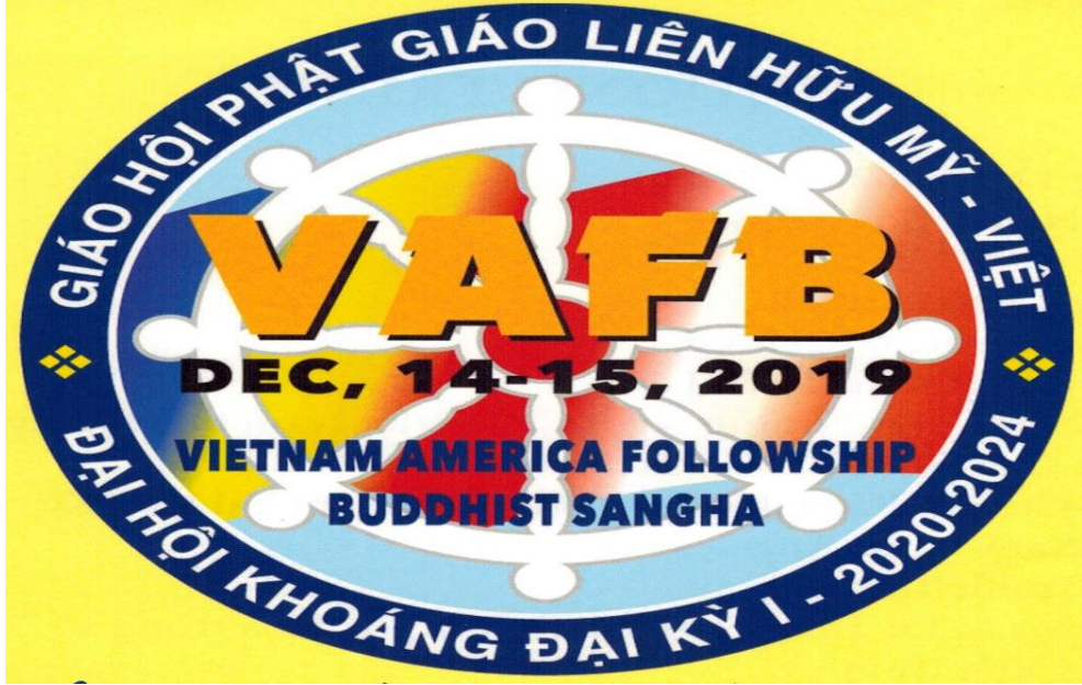
Hội Nghị Giáo hội Phật Giáo Liên Hữu Mỹ Việt Ngày 14-15 tháng 12 năm 2022