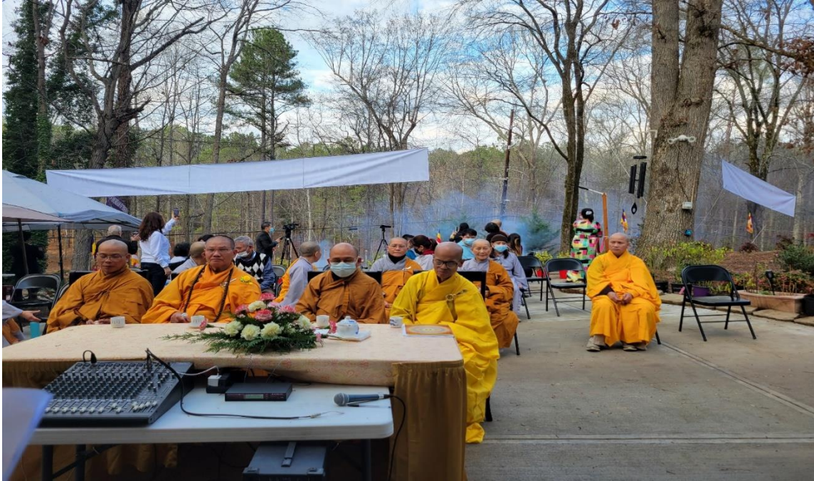
Lễ Giao thừa và Năm mới tại Thiền viện Thiên Ân (01/01/2022)