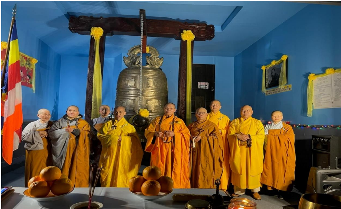
Gióng chuông hòa bình tại Thiền viện Thiên Ân (01/01/2022)