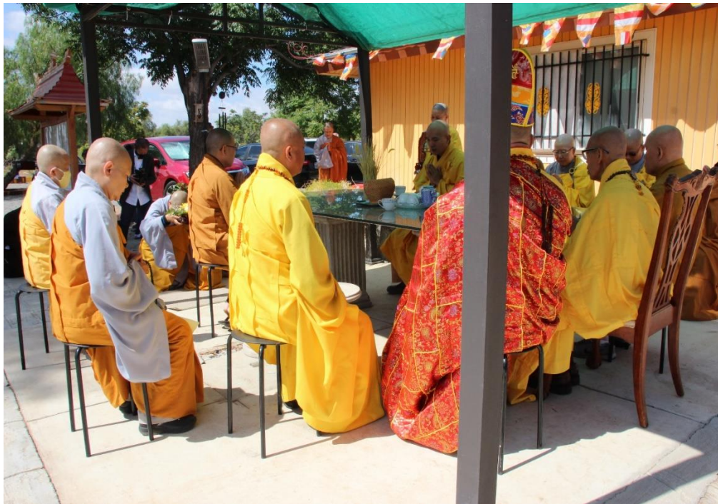
Lễ Phật đản tại chùa Hương Sen (ngày 29/05/2022)