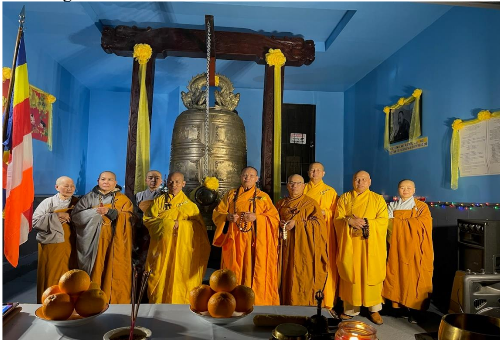
Photo: Giao thừa năm 2022

Thông điệp Hòa bình mà Đức Phật dạy trong nhiều kinh là ánh sáng Từ bi và Trí tuệ sẽ đẩy lùi bóng tối vô minh đem lại sự tỉnh thức cho loài người và hòa bình cho thế gian.”