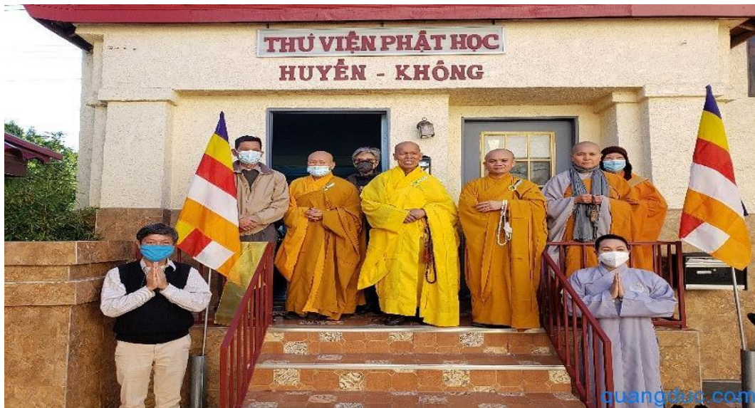
Mặt trước Thư Viện Huyền Không