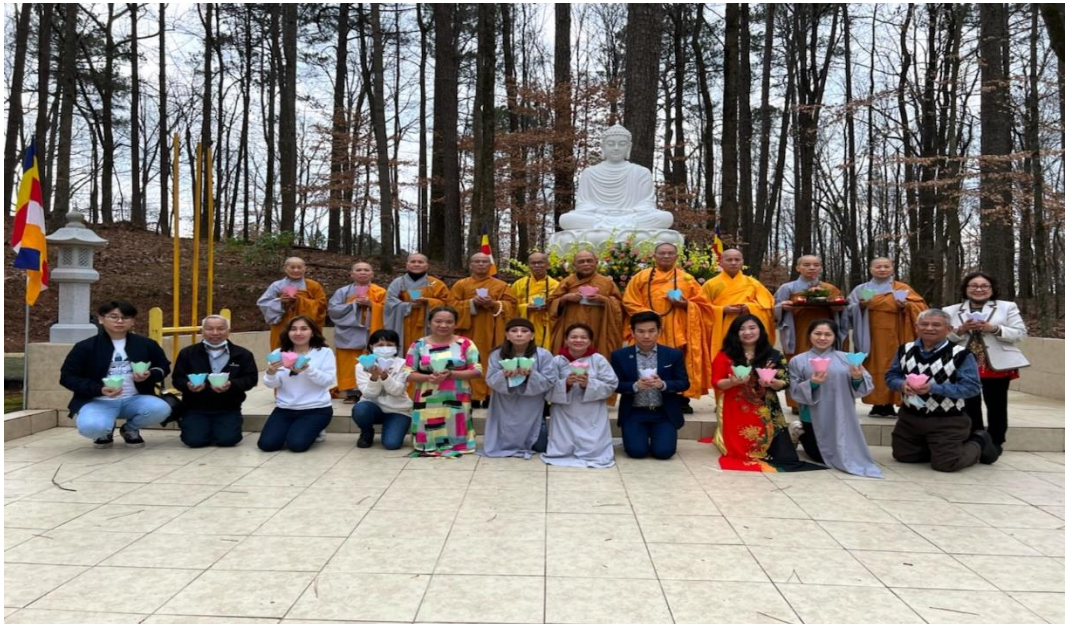
Lễ Giao thừa và Năm mới tại Thiền viện Thiên Ân (01/01/2022)