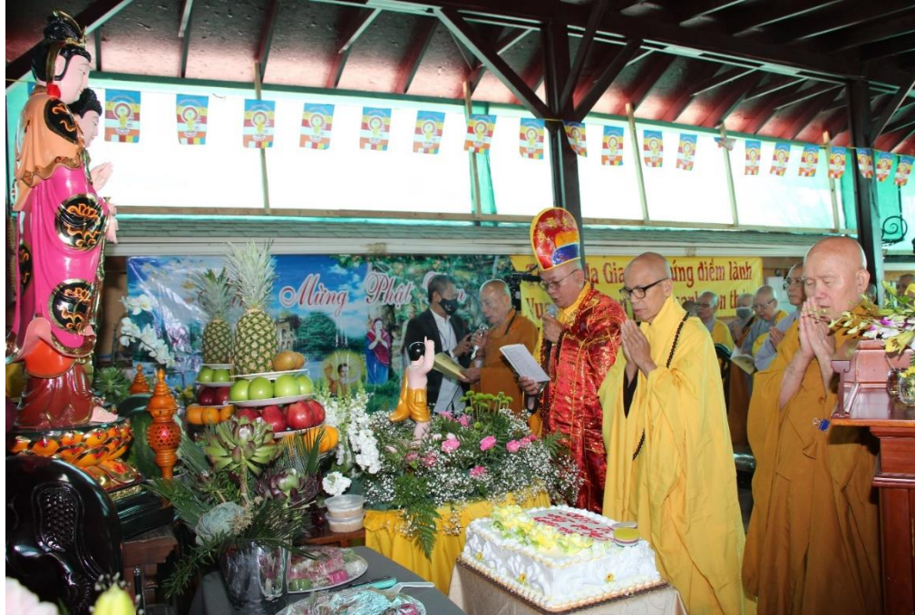
Tụng kinh Khánh đản chùa Hương Sen (ngày 29/05/2022)