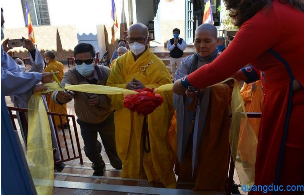
Cắt băng khánh thành Thư Viện Huyền Không