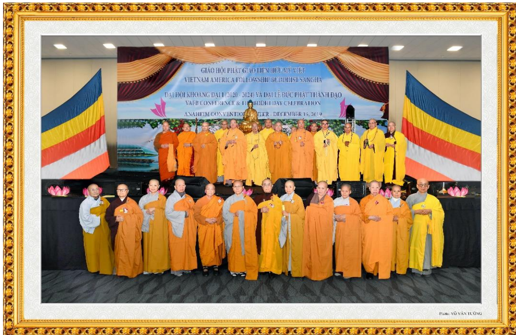
Hội Nghị Giáo hội Phật Giáo Liên Hữu Mỹ Việt Ngày 14-15 tháng 12 năm 2022