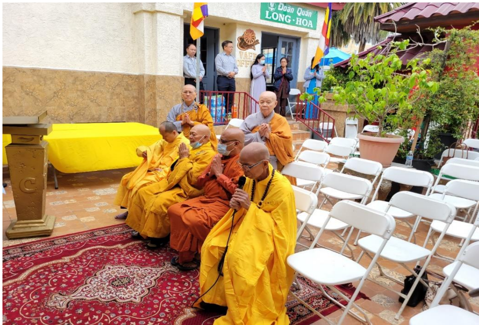
Lễ Phật đàn chùa Việt Nam (ngày 08/05/2022)