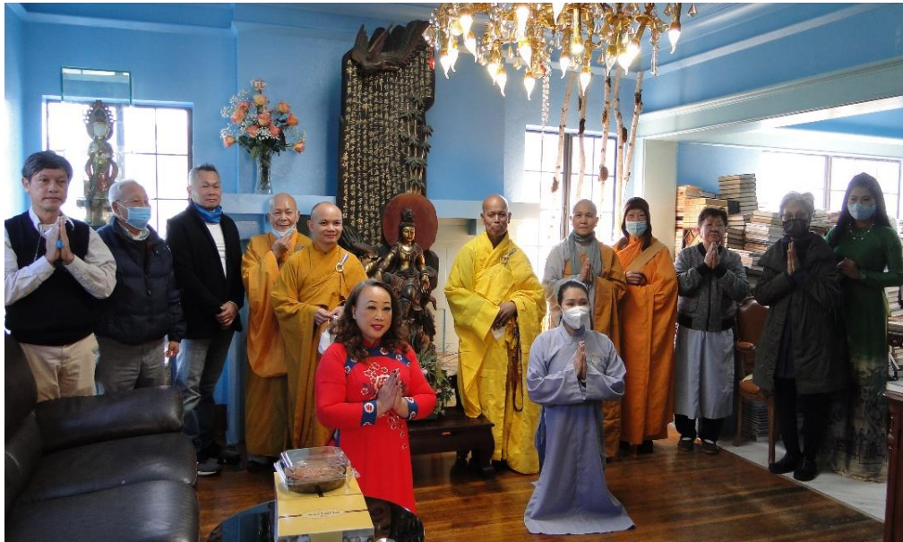
Khai mạc thư viện Huyền Không (ngày 10/03/2021)