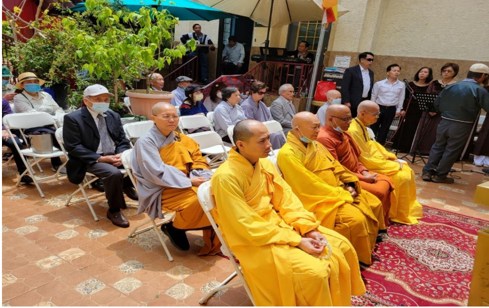
Lễ Phật đản chùa Việt Nam (ngày 08/05/2022)