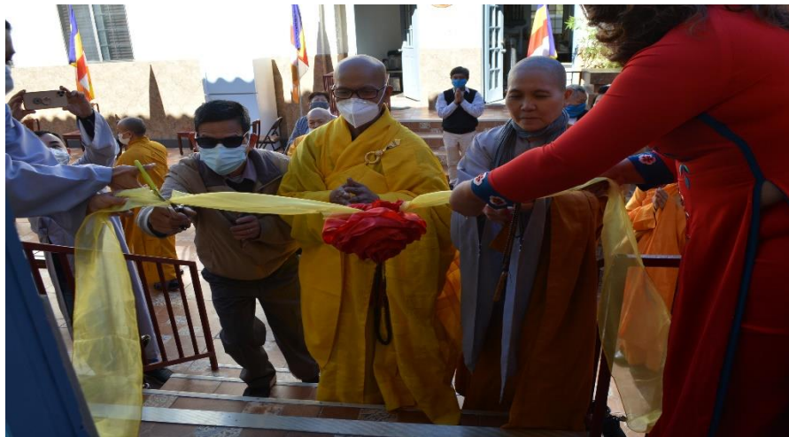
Cắt băng khánh thành Thư Viện Huyền Không