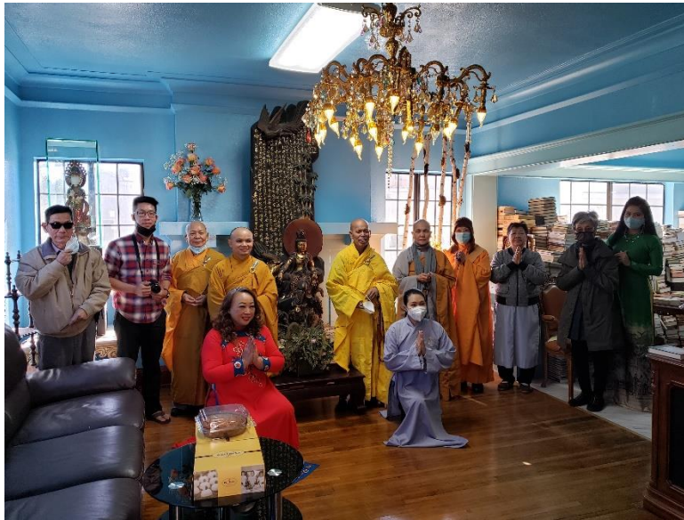
Phòng đọc sách