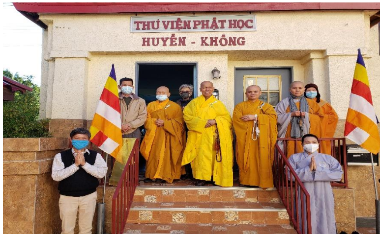
Mặt trước Thư Viện Huyền Không